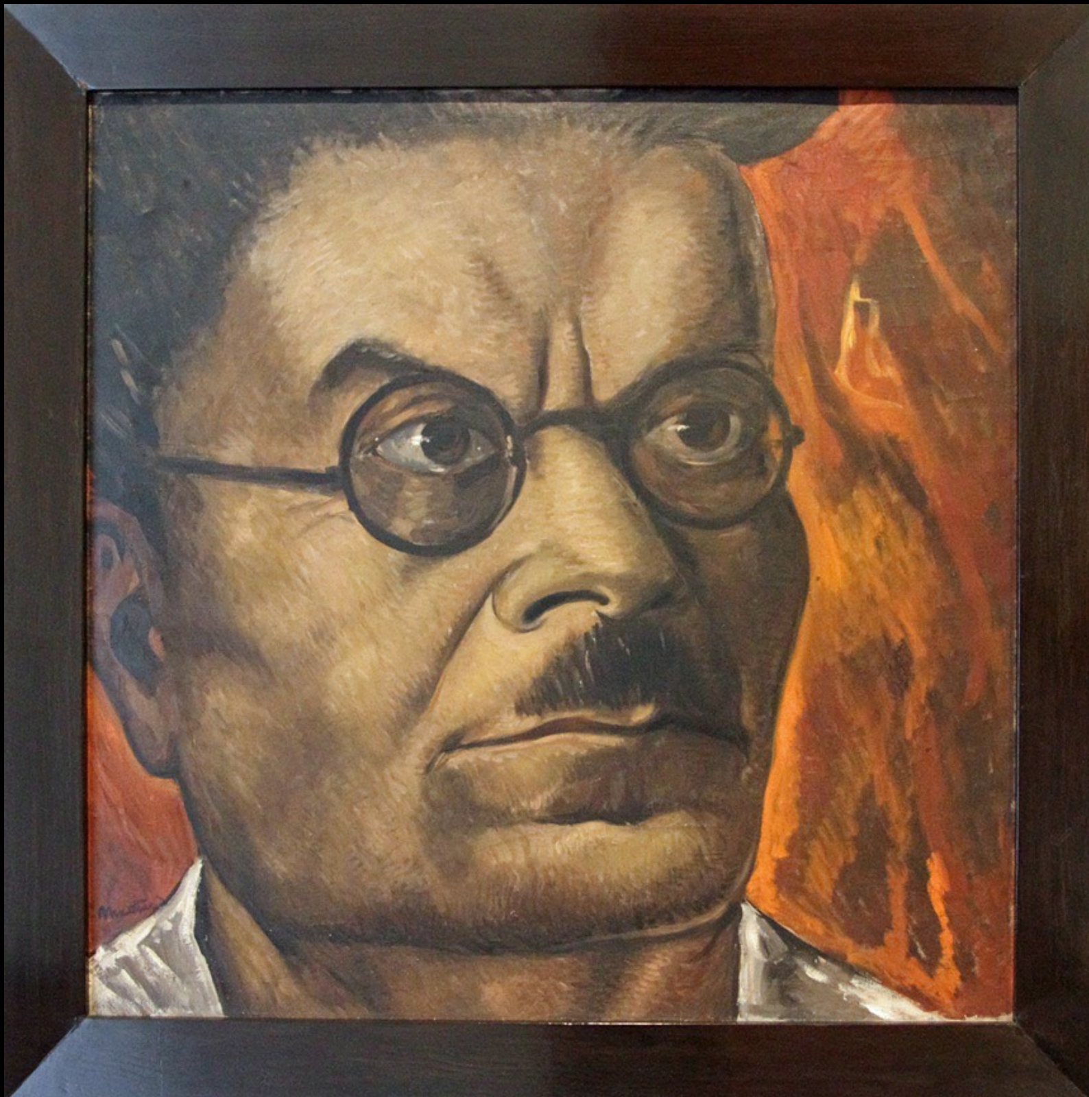
Roberto Montenegro, José Clemente Orozco (1883-1949)