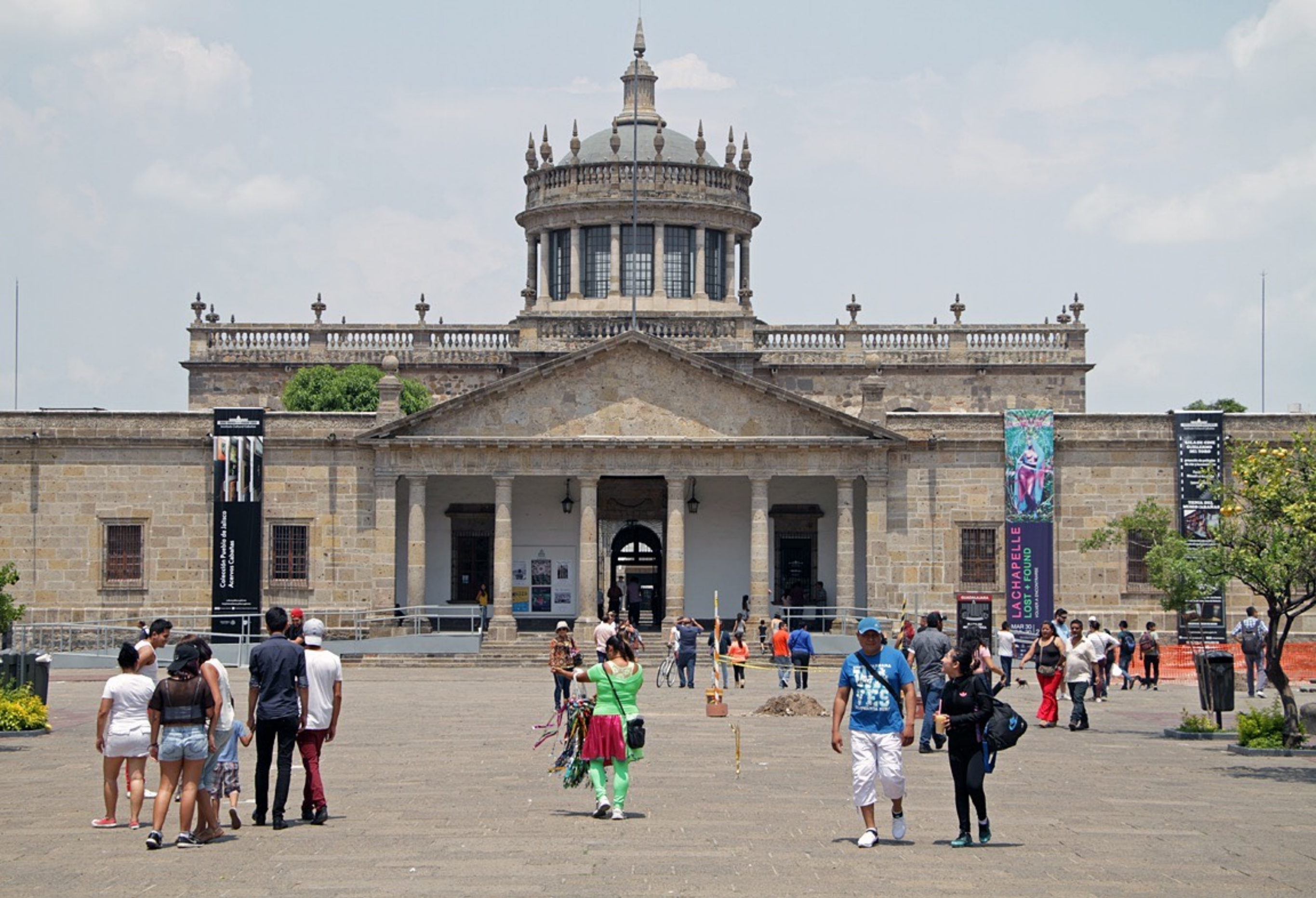
Hospicio / Instituto Cultural Cabañas, Guadalajara, 1805, estilo neoclásico fundador: Obispo Juan Ruiz de Cabañas / arquitecto: Manuel Tolsá