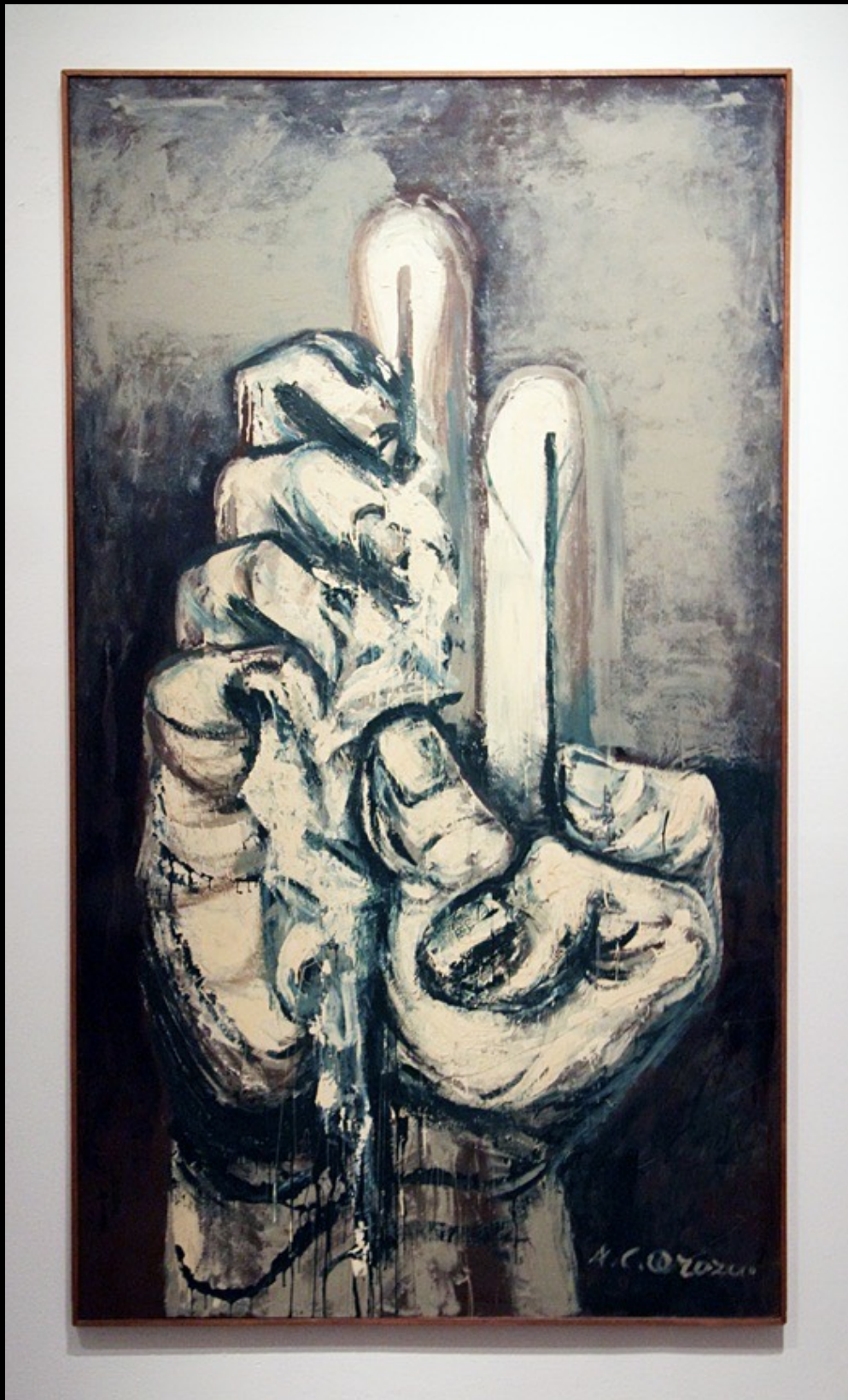
Mano (194), piroxilina sobre masonite Instituto Cultural Cabañas, Guadalajara