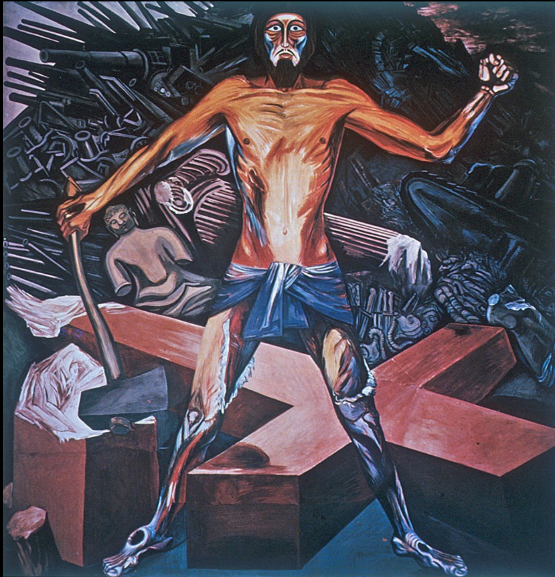
Orozco, Christ and His Cross, Baker Library, Dartmouth College, New Hampshire