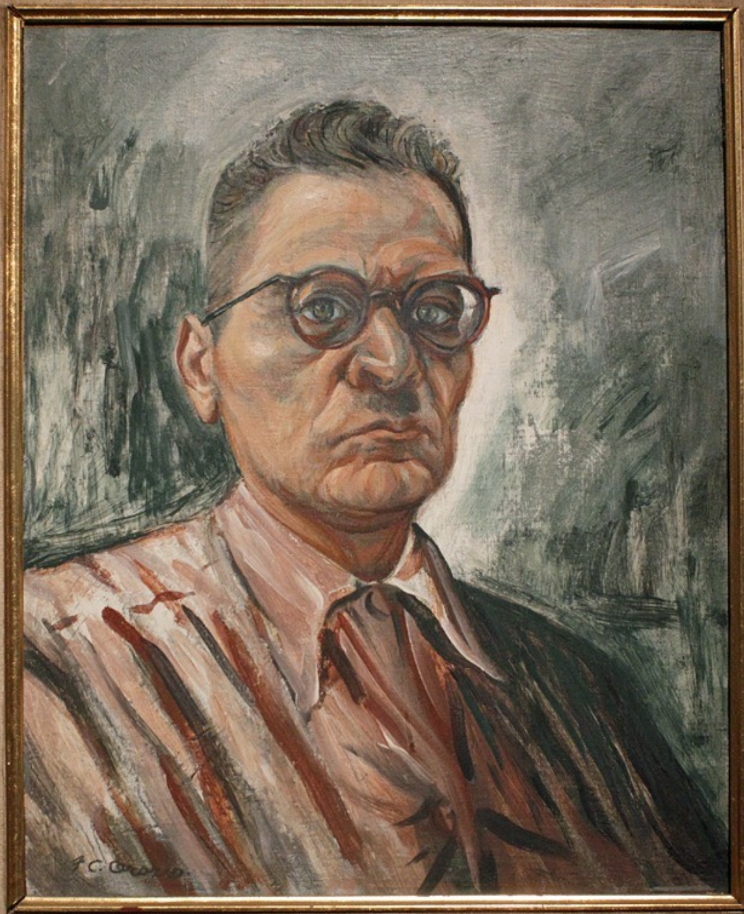
José Clemente Orozco Autoretrato, 1946, temple s tela, Museo de Arte Moderno México