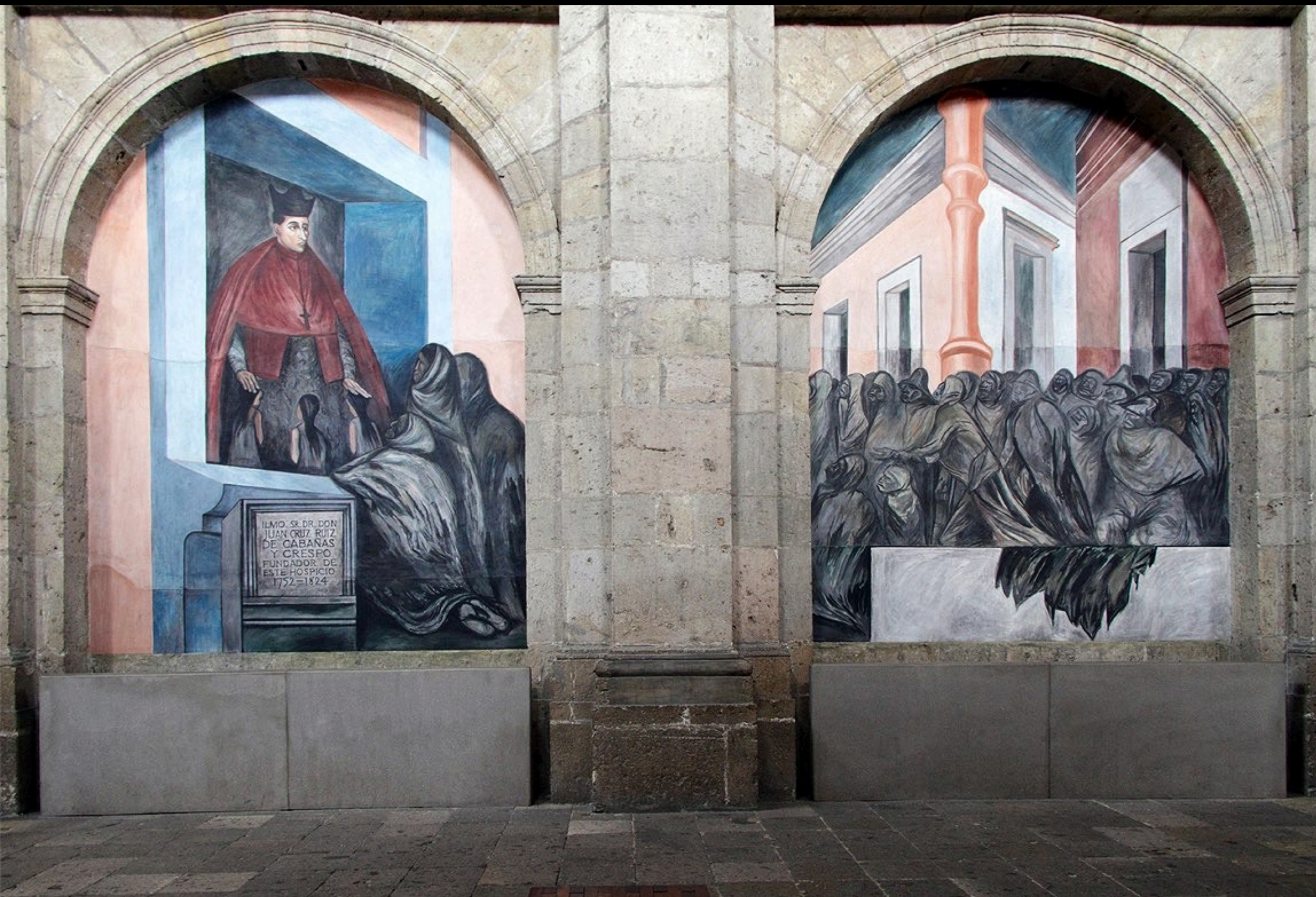
fundador Obispo Juan Ruiz de Cabañas