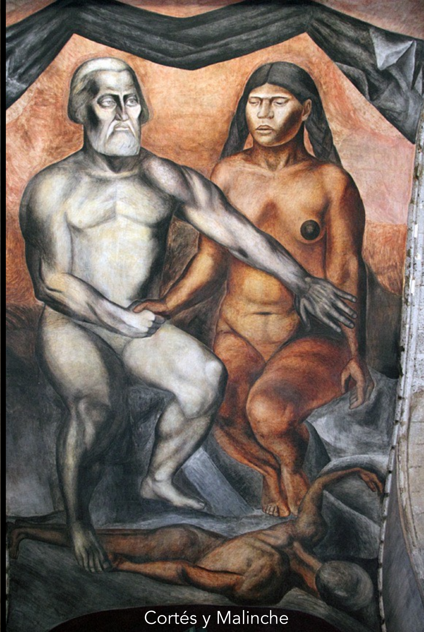
Cortés y Malinche