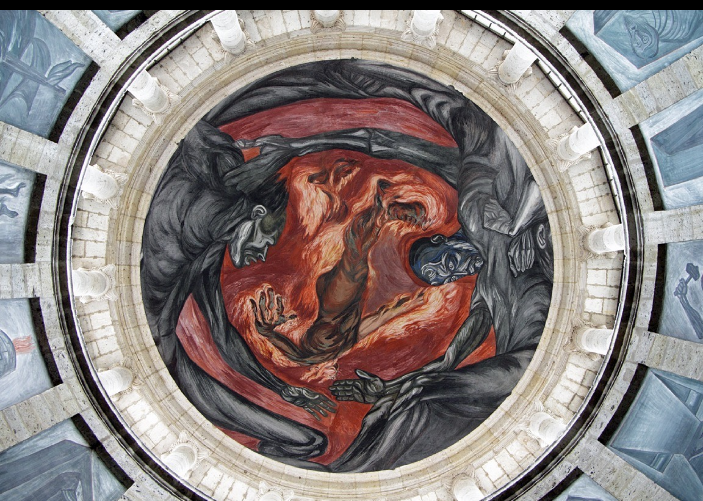
„Hombre en Llamas” escapando por una cúpula „abierta en gloria” (como en la pintura barroca)