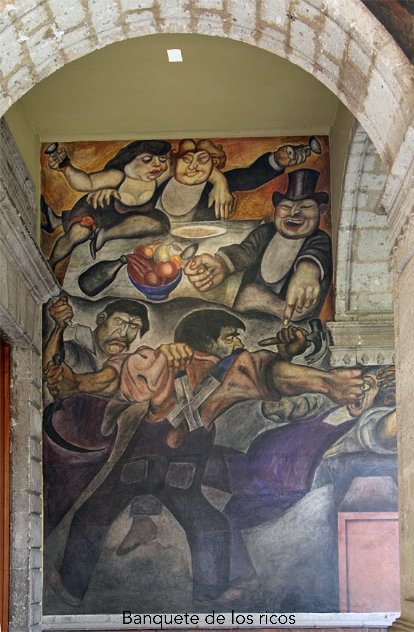
Banquete de los ricos