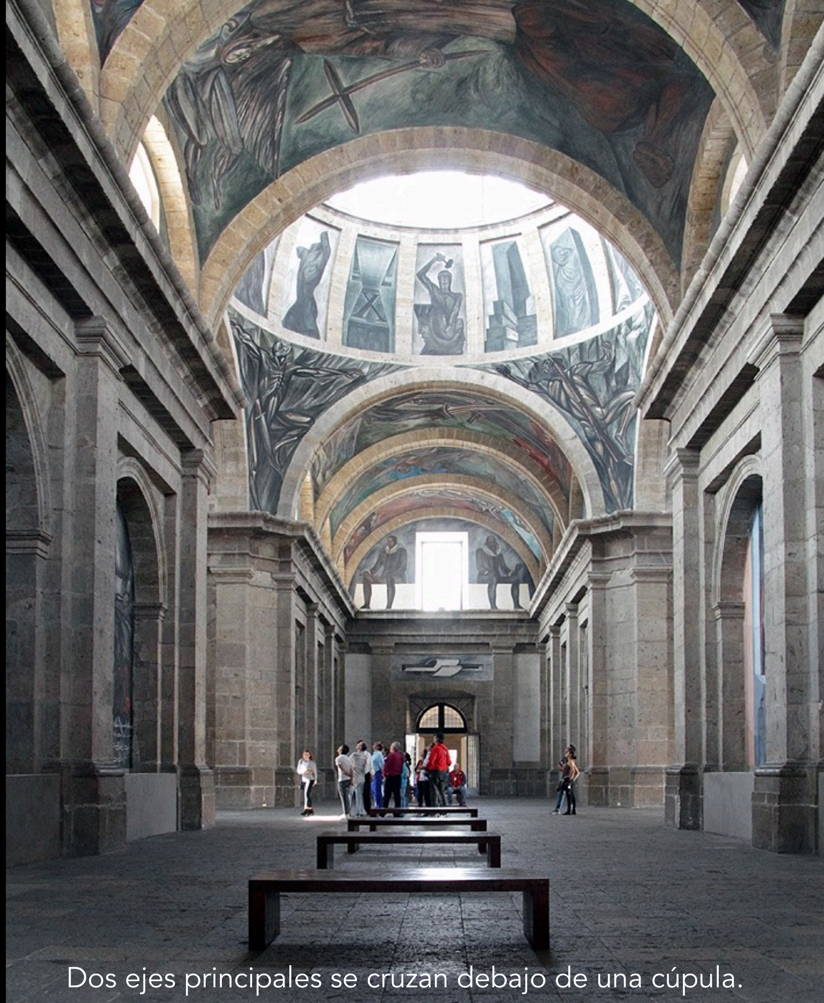
Dos ejes principales se cruzan debajo de una cúpula.