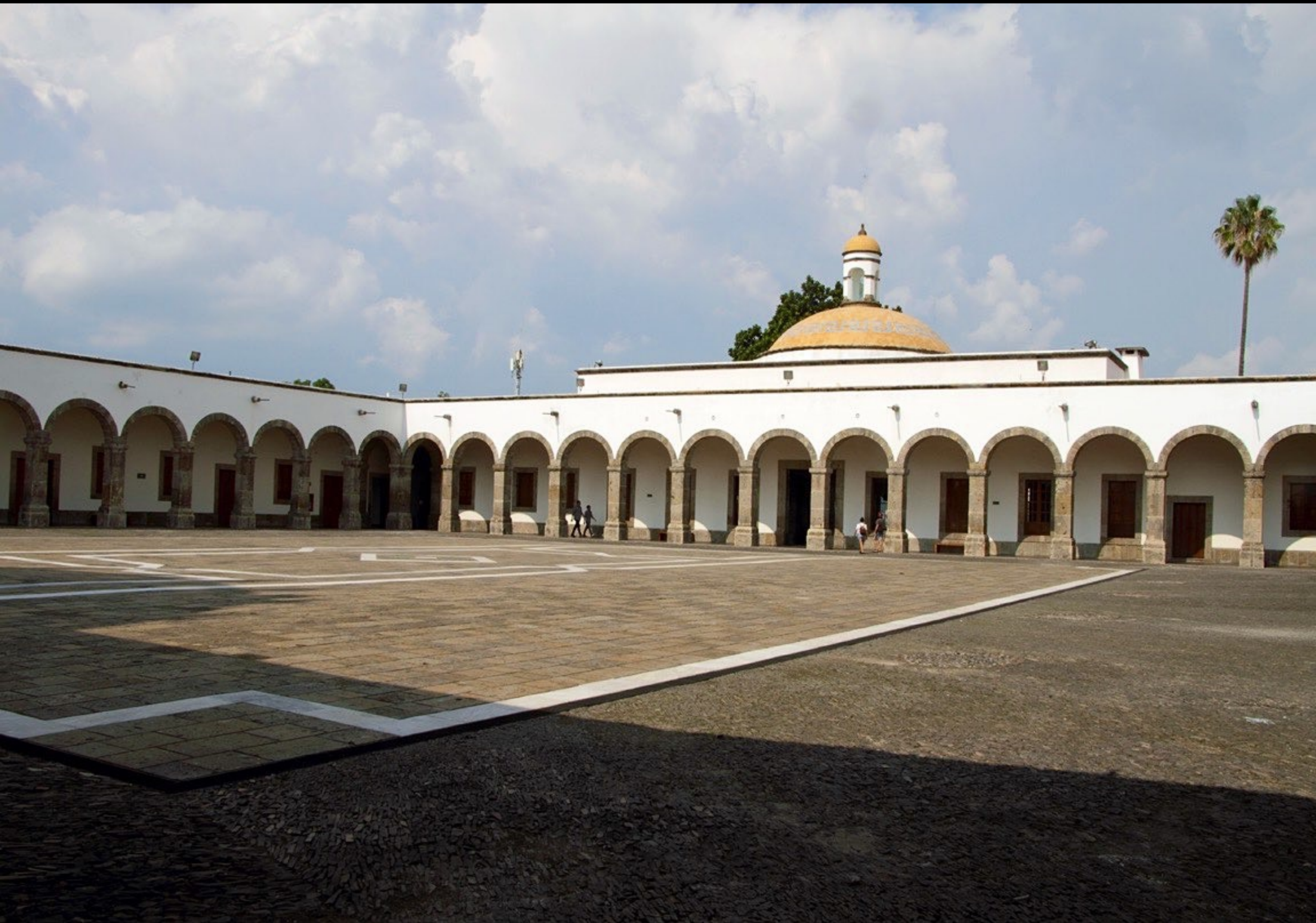
2 patios grandes y 21 pequeños